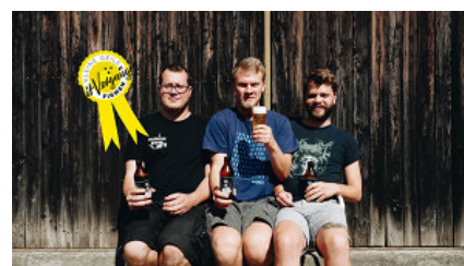
Kleine, geile Firmen #37 – Craft Beer von der Munich Brew Mafia