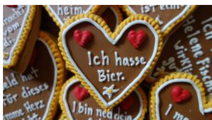
Mit unseren Wiesn-Herzen für das Ambulante Kinderhospiz spenden!